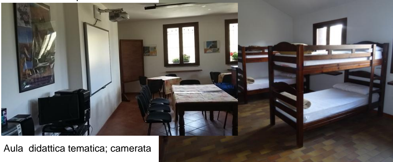
Aula didattica tematica; camerata