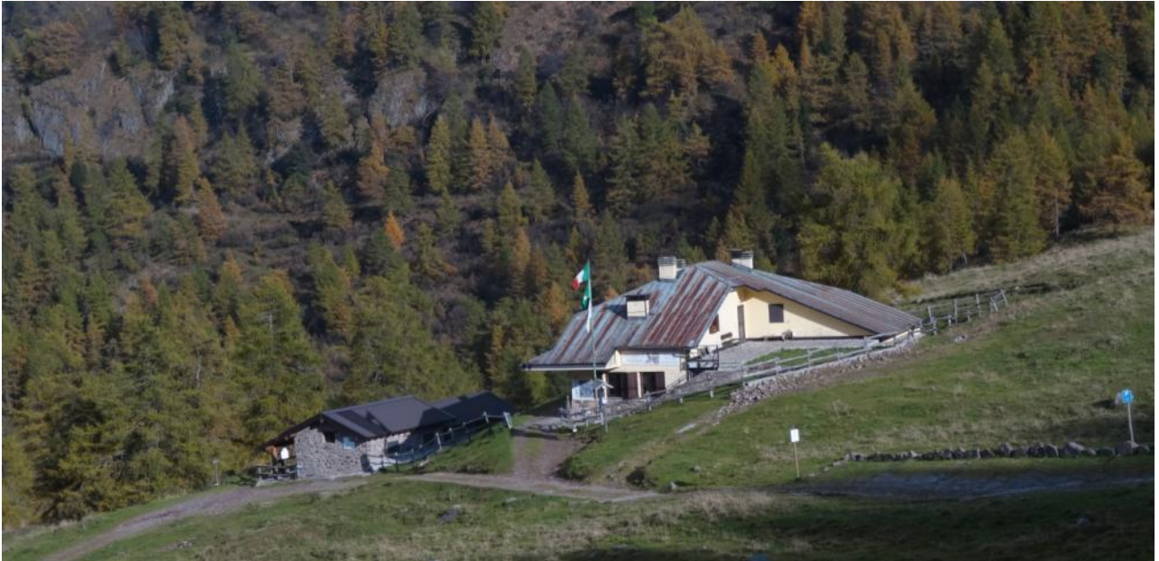
BAITA RIFUGIO ROSELLO - LATO OVEST