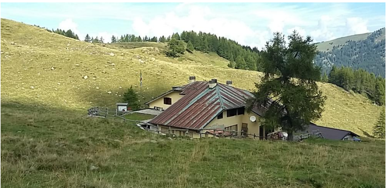
BAITA RIFUGIO ROSELLO - LATO SUD-EST