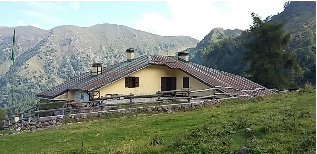
BAITA RIFUGIO ROSELLO - LATO SUD-OVEST